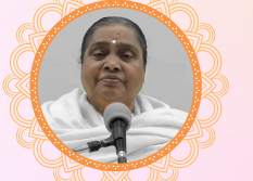
ब्र. कु. लक्ष्मी उपाध्यक्ष, राजनीतिज्ञ सेवा प्रभाग